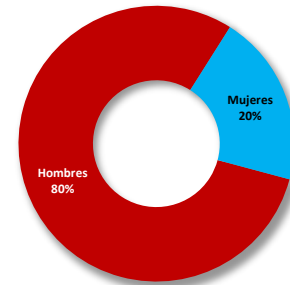
Cuadro No. 2 EXTRANJEROS CON ESTATUS IRREGULAR Y FALTAS A LA LEGISLACIÓN ADMINISTRATIVA Y PENAL REMITIDOS POR RAZÓN: AÑO 2010-2021